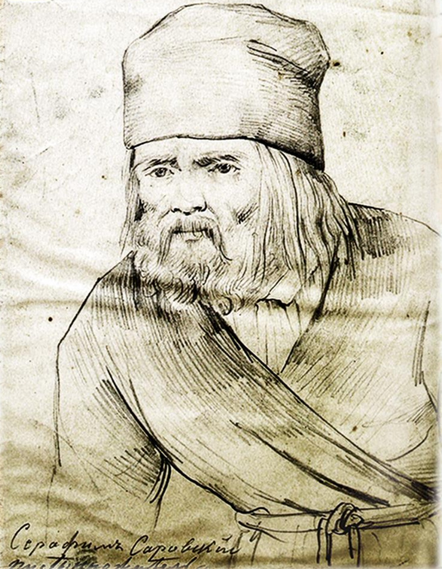
Серафимъ Саровскій м. 1838 г.

Прижизненный портрет преп. Серафима Саровского