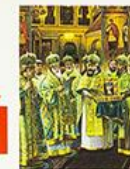
Серафим Саровский был канонизирован в июле 1903 года

Тираж серии «История России» более 2500 000 экземпляров