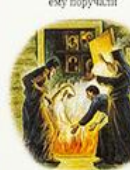
«Кончина моя откроется покаянием», — сказал Серафим инокам. Так и случилось