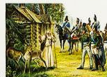
Смеялись на троне цари, шли войны, а Серафиму вознесла молитвы Богу во славу России