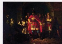
П. Чистяков. Патриарх Гермоген отказывается полякам подписать грамоту