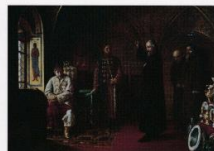
Я. Турлыгин Митрополит Филипп и Иван Грозный