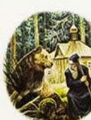
Лесной отшельник Сера- фим как будто понимал язык птиц и зверей