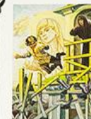
Урал Пророк, но не разбился. С Божьей по- мощью он остался жить