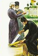
Молодой послушник не знал усталости и радовался любимой работе, которую ему поручали