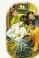
В лавке брата Прохора читал духовные книги своим сверстникам